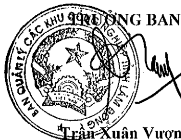
Trần Xuân Vượng